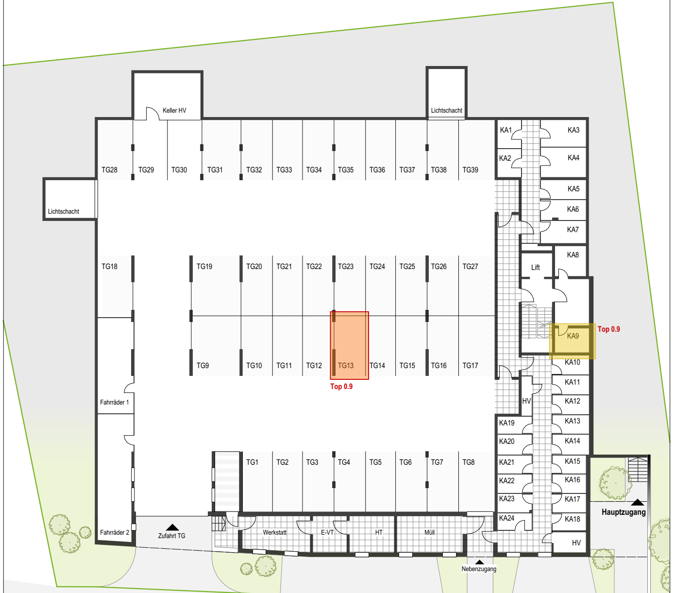
Übersichtsplan Keller ohne Maßstab